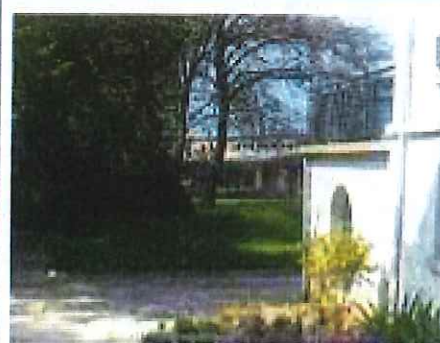
Cent mètres de liaison de douce entre les retraités et la petite enfance

A l'autre bout du sous-bois, c'est le relais d'assistantes maternelles itinérant, "l'Écoccinelles" qui gazouille tous les lundis matins et s'anime régulièrement en semaine. Renseignements à la mairie. (Ci-dessous, le Ram à Thignonville)