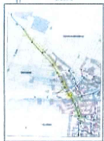
Rue de Pannecières et une partie de la rue de Morville