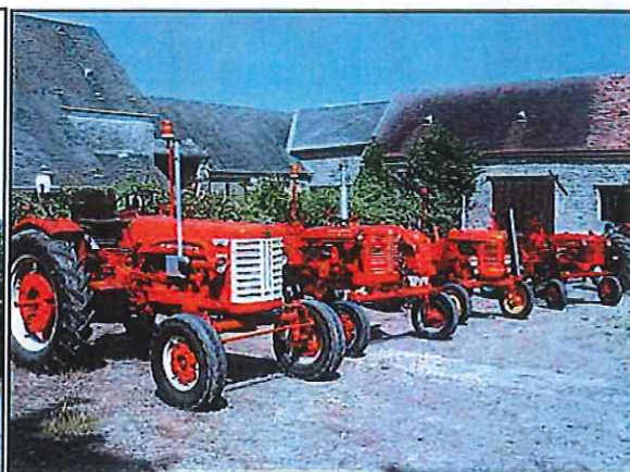
La collection Malbranche