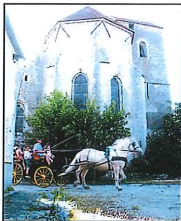
L'entrée en scène