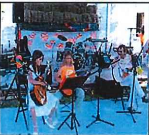
La magie jusqu'au bout de la nuit