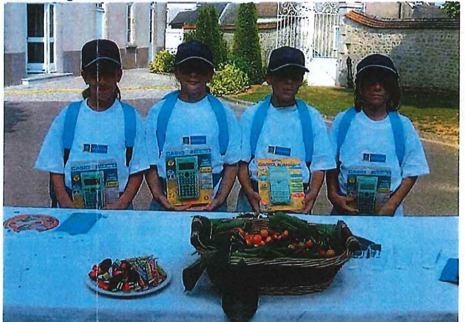
Nous tenons à rassurer les parents d'élèves : la cérémonie a bien été parrainée par le Conseil Général et non pas par une célèbre marque de calculette dont nous tairons le nom...