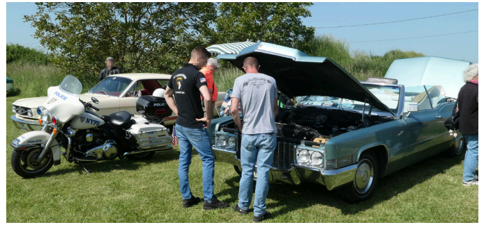
Quelques modèles d'outre Atlantique.