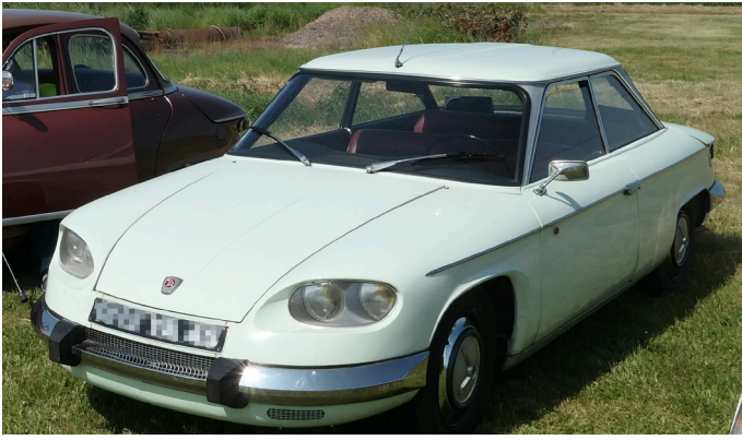
Panhard PL24, la dernière production de la marque.