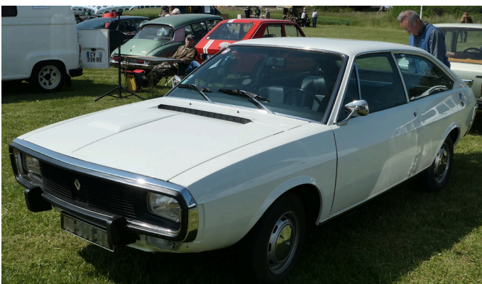
Renault 15. 50 ans déjà !!!