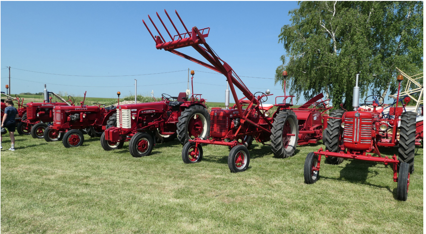
Des tracteurs entièrement restaurés d'origine après de longues années de bons et loyaux services.