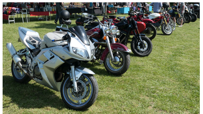
Side-cars et motos.